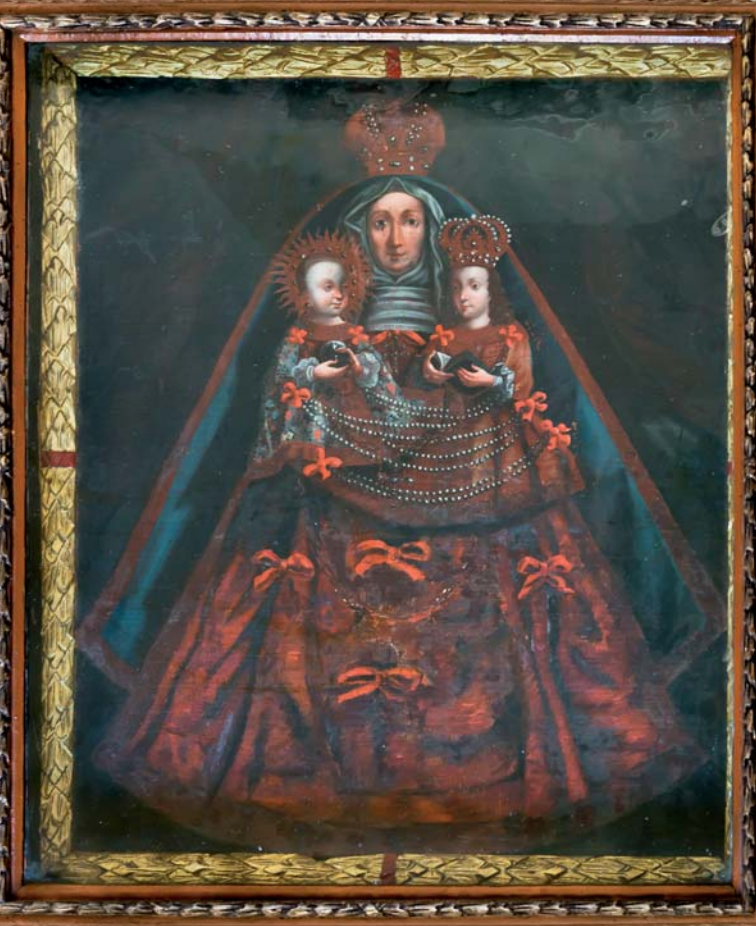
Obraz sv. Anny Samětřetí z původního oltáře, kolem roku 1680.

nak na jména umělců skoupá. Jednalo se o oltář sv. Kříže a údajně oltář Narození Panny Marie . Takto ho označují však pouze na tomto jediném místě, v ostatních případech jej nazývají Narození Spasitele ; proto se toto zasvěcení jeví jako pravděpodobnější. V roce 1822 oba obrazy nahradila plátna se sv. Josefem Kalasanským a sv. Kateřinou. Barokní inventář zmiňuje další dva oltáře – sv. Anny a Panny Marie . Úcta ke sv. Anně – vychovatelce Panny Marie – byla samozřejmě piaristům velmi blízká; ostatně jejich kostel v Benešově (1704) jí byl také zasvěcen. Ve sbírkách slánského muzea se dochovalo plátno sv. Anny Samětřetí (kol. r. 1680), které je tradičně s piaristy spojováno a které je také velmi pravděpodobně zbytkem zmíněného oltáře. Je na něm sv. Anna s korunovanou Pannou Marií s knížečkou v ruce a malým Ježíškem – Vykupitelem s motivem jablka v ruce. Pokud se jedná o oltář Panny Marie, je otázkou, zda se na něm tehdy nenacházela kopie milostného obrazu Panny Marie z Wessobrunu, který se pak objevuje na devočních grafičkách a tzv. brandeu slánského bratrstva.