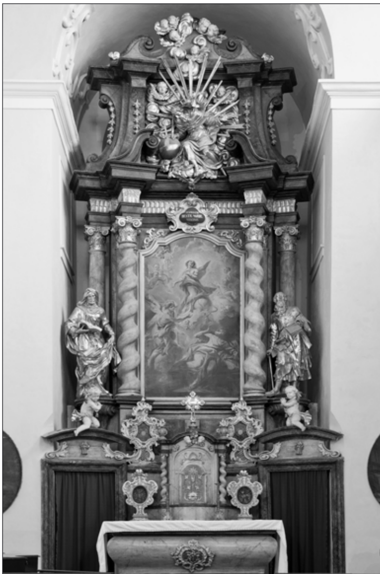
Kolejší kaple, hlavní oltář s obrazem Zasnoubení P. Marie od Carla Inocenze Carloneho z roku 1727.

lekcí pak doplňuje větší monstrance a misál v červené sametové vazbě se stříbrným rokokovým kováním.