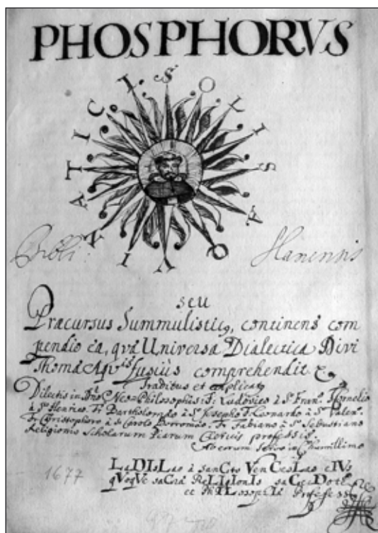
První strana rukopisu Phosphorus Solis Aquinatici.

Řadu svazků získala knihovna piaristů ve Slaném také prostřednictvím darů