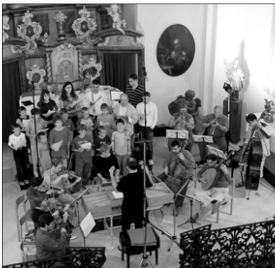
Titulní list soupisu hudebnin slánského piaristického kůru z roku 1713 (vlevo). Capella Regia a Pueri Gaudentes při nahrávání v piaristické kapli.

Naší snahou bylo, aby výsledná nahrávka byla co nejautentičtější. Hráli jsme na historické nástroje nebo jejich kopie, v autentickém prostředí a podle pravidel dobové hudební praxe – což znamená, že výsledný zvuk se co nejvíce podobá tomu, co mohli slyšet účastníci liturgie v 17. a 18. století. Tomuto záměru odpovídá i použití sólových zpěváků také jako sboristů a sbor – samozřejmě chlapecký. Také mešní gregoriánské antifony byly vybrány z antefonářů slánské piaristické knihovny.