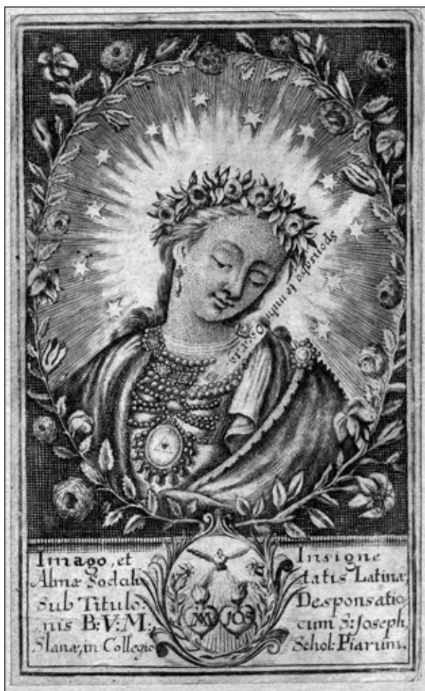
Devoční grafika slánských sodálů s milostným obrazem Panny Marie z Wessobrunnu, 17. stol.

kruchty spatříme obléhání města křesťanským vojskem. V horní části je pak namalována postava Pomocnice křesťanů – Panny Marie na zeměkouli s hadem, Immaculaty. I to je jeden z charakteristických znaků doby, kdy se vedl mezi teology spor o uznání dogmatu Neposkvrněného početí Panny Marie. Podle tehdejší věrouky šlo o uznání faktu, že Panna Maria byla již od svého početí pro zvláštní milost Boží a předvídané zásluhy Ježíše Krista uchráněna poskvrny dědičného hříchu. Toto učení prosazovali zejména františkáni a jezuité. A právě tehdy se na obranu křesťanských hranic proti Turkům šikují „rytíři Neposkvrněného početí“ a panovníci se modlí střelnou modlitbu – O, Panno Maria, bez hříchu prvotního počatá, oroduj za nás. Jen v těchto