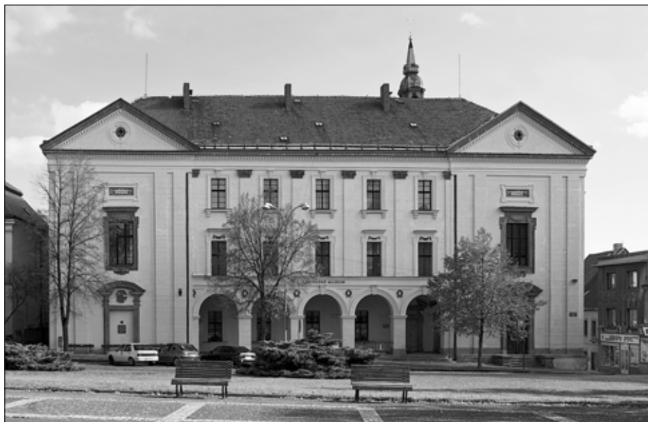
Bývalá kolej piaristů ve Slaném, založena v roce 1658, upravena 1877–1878.