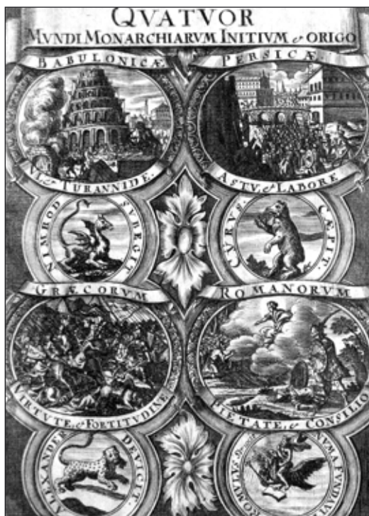
Mědirytinový frontispis z knihy Novissimum Historiae Quatuor Mundi Monarchiarum Compendium.

Není ovšem nikterak vyloučeno, že obsáhlý knižní soubor slánských piaristů, jenž stojí v muzejních regálech nejen jako tichá připomínka dávno zašlých časů, ale zároveň představuje také výzvu pro současné badatele, může skýtat ještě mnohá překvapivá zjištění.