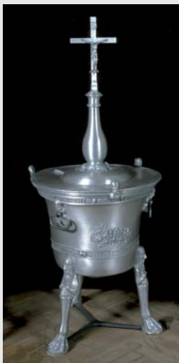
Cínová křtitelnice v jižní lodi, 1511