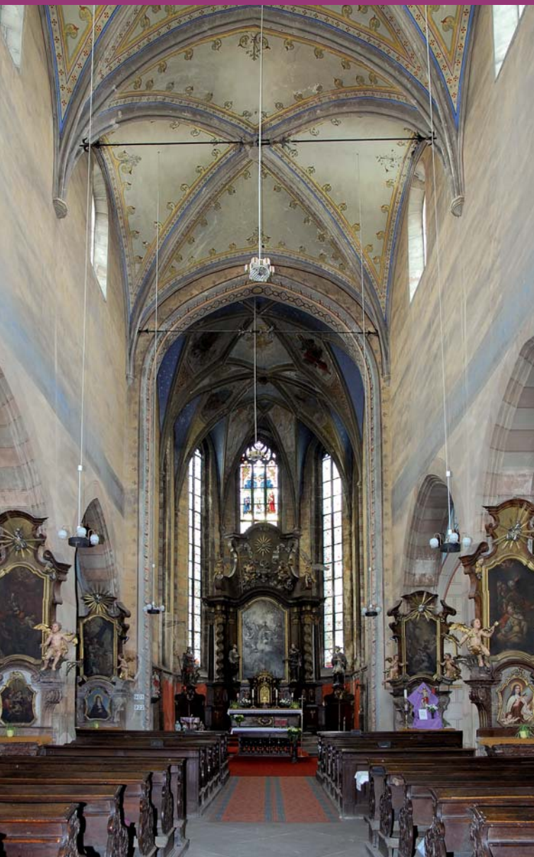
Interiér, pohled k východnímu závěru

Památky Slaného a Slánska (5) • Chrám sv. Gotharda ve Slaném text Marek Filipец • grafická úprava Ivo Horňák fotografie Pavel Východil a Jiří Jaroš vydal odbor kultury MěÚ Slaný, Velvarská 136, 274 01 Slaný tisk KOČKA Slaný AD 2013 • www.pamatky.slany.cz