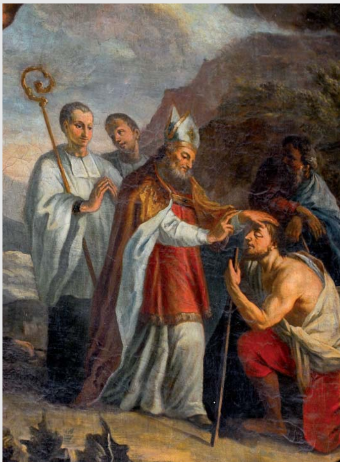
Hlavní oltář, detail obrazu se sv. Gothardem, po r. 1760