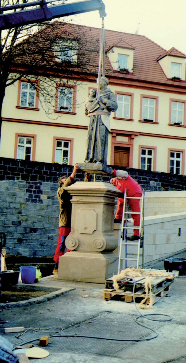
Instalace sochy sv. Antonína, podzim 2011.